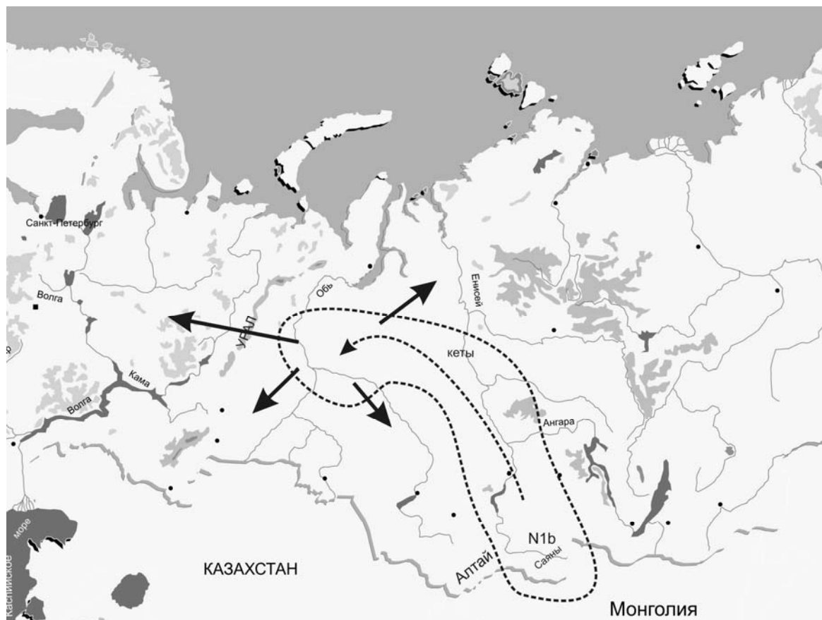
Карта 1. Первичные миграции гаплогруппы N1b.

Исходя из расположения разных кластеров гаплогруппы N1b, намечается следующий маршрут этой группы: от Саян по Енисею с выходом к Нижнему Приобью.