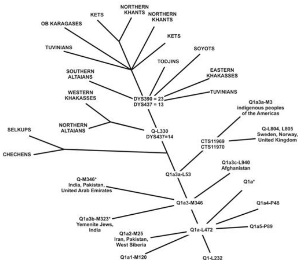
Схема 1. Филогенетическое древо гаплогруппы Q1a3. Древо создано на основе базы Y-гаплотипов лаборатории эволюционной генетики НИИ медицинской генетики ТНЦ СО РАМН, данных из проектов FTDNA и SMGF, а также данных из работы: (Malyarchuk 2011).

топонимы от терминов сес, зес, сат, тет, дат, шет, чет , которые в разных диалектах кетов имеют значение «река». Примерами являются многочисленные западносибирские гидронимы Айзас, Толзес, Алсат, Итат, Айдат, Бакчет, Тайшет и др. (Дульзон 1960: 291).