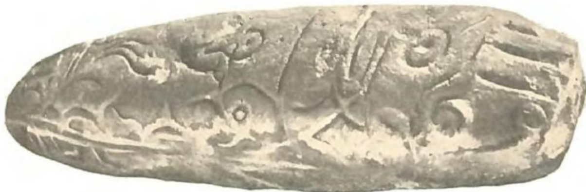
Рис. 1. Общий вид изваяния.

Впоследствии история появления этого изваяния в Академгородке осложнилась: его в свое время будто бы нашли студенты-геологи на берегу оз. Шира и привезли в Новосибирск, где оно длительное время пролежало в кабинете биологического факультета университета, оставаясь неизвестным археологам, а затем было утеряно. Однако один из этих студентов, увидев рассматриваемое здесь изваяние, сказал, что там было найдено другое; таким образом, происхождение этой скульптуры остается невыясненным.