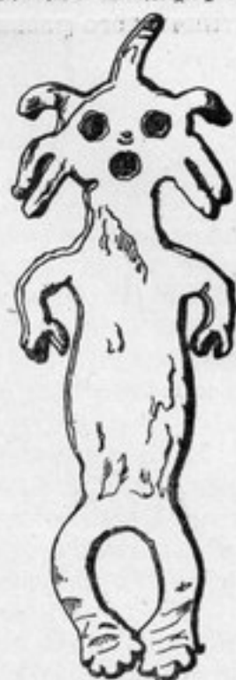
Рис. 4. Антропоморфное изображение из олова, предмет культа (№ 6769-27).

Особо в коллекциях последнего десятилетия следует выделить материал, представляющий традиционные верования и культы. Значительная часть его в собраниях Музея появилась впервые, открывая новый источник знаний по духовной культуре кетов. Так, например, информационные данные, позволяющие говорить о существовании в прошлом нескольких категорий шаманов, дополнились материальными свидетельствами этого явления. Прежде всего, следует упомянуть уникальные предметы облачения шамана категории қандэл'ок . Впервые в Музей поступила налобная повязка — головной убор начинающего шамана (рис. 3). В руки собирателей не попадали обычно изображения умерших родственников ( дауол'с ), так как их наследовали по мужской линии из поколения в поколение как семейных и родовых охранителей. 24 Единственными в кетских коллекциях Музея являются изображения некоторых мифологических персонажей (№ 6661-49, 60), и особенно одно из них — антропоморфная фигура из олова с семью лучами-отростками, отходящими от головы (рис. 4). Аналогичные изображения, в которых кеты признают мифологического Сына земли, встречаются нарисованными охрой на обтяжке бубна, шаманских нартах-ящичках ( қоссул ), на подвесках (процарапаны или выбиты точками) шаманского костюма, 25 но скульптурный вариант является единственным. 26