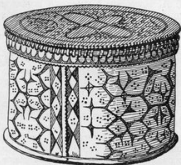
Рис. 1. Берестяная коробочка, доставленная М. А. Кастреном (№ 27-40).

Первый экспонат поступил в середине XIX в. от известного исследователя самодийских и енисейских языков М. А. Кастрена. В числе других вещей, переданных М. А. Кастреном в Музей после возвращения из путешествия по Сибири в 1845—1849 гг., находилась круглая с крышкой берестяная коробочка, украшенная с наружной стороны орнаментом (рис 1). На коробочке имеется надпись: «Arbeit d. Ostjaken am Jenissey v. Dr. Castren, 1846». В подобных изделиях из бересты кеты и в настоящее время хранят продукты (чай, сахар) или какие-либо мелкие предметы. Орнамент (сочетание вильчатых фигур) также очень традиционен для прикладного искусства кетов. В собраниях Музея он представлен