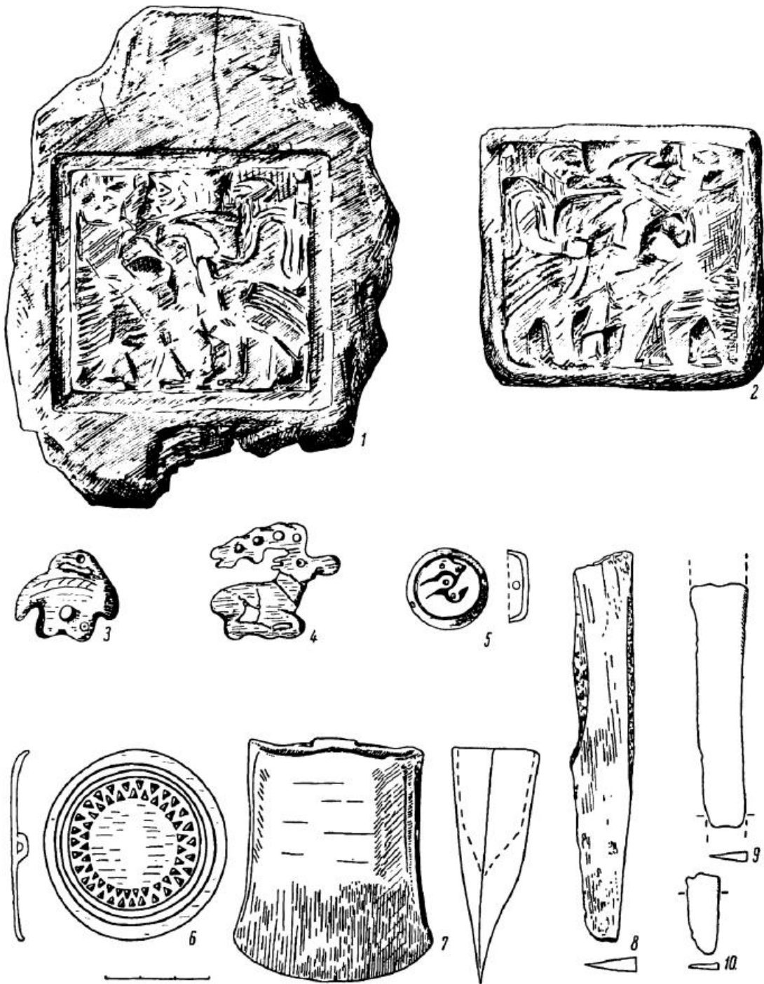
Рис. 1. Створка глиняной литейной формы и бронзовые изделия.

1, 2 — створка глиняной литейной формы и ее муляж; 3 — крючок для подвешивания колчана (?); 4 — фигурка оленя; 5, 6 — бляшки; 7 — кельт-гесло; 8 — нож; 9, 10 — обломки ножей.