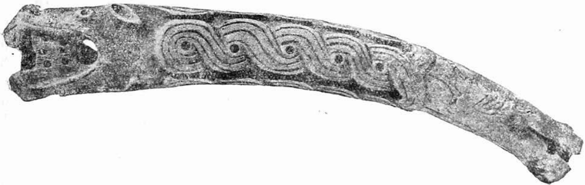
Рис. 3. Костяная рукоять пшети.