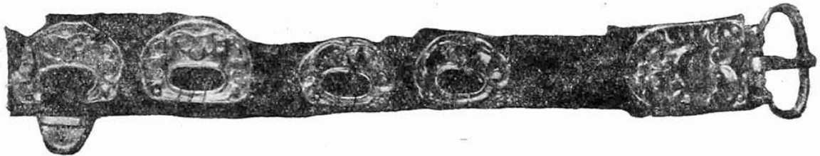
Рис. 4. Часть пояса с золотыми бляхами.