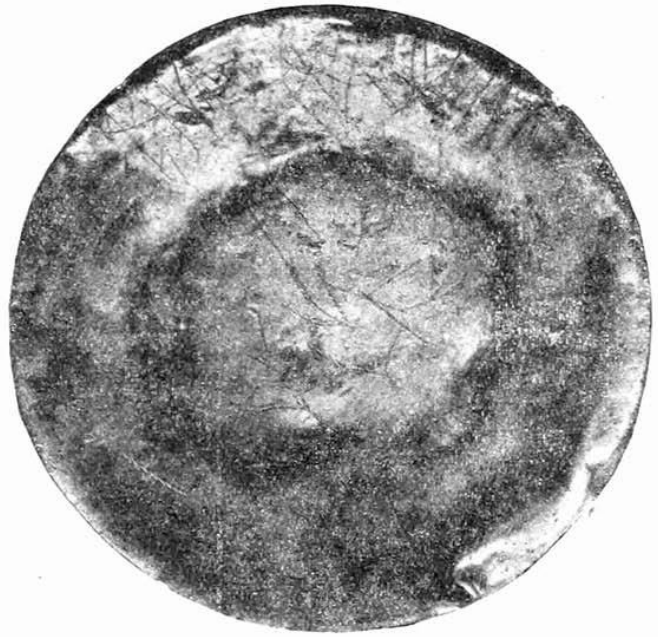
Рис. 1а. Дно кувшинчика с резными надписями.