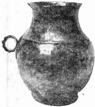
Рис. 1. Серебряный кувшинчик.