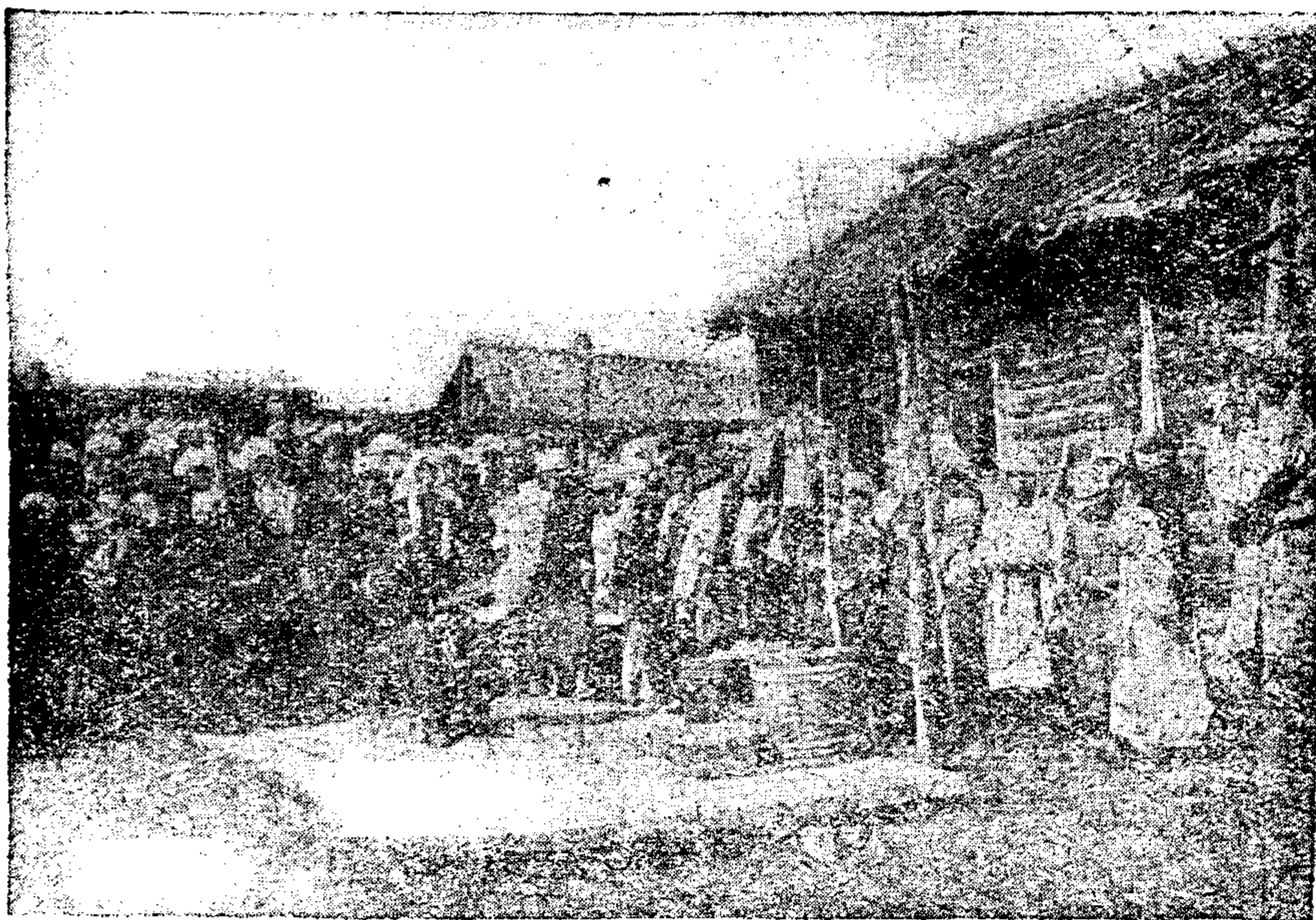
Фотогр. № 1.

божество, которое впоследствии после ссоры со своим помощником и другом Эрликом, летавшим или плавающим рядом с ним также в образе птицы, после законченного творения отходит от людских дел, отдав и землю и людей в распоряжение Эрлика, ставшего уже его врагом, и лишь отчасти предоставив их заботам своих посланцев и сыновей. И, удалившись на высочайшую гору, скрывается за шелковой занавесью, приказывая людям приносить себе жертвы у подножья этой горы 1) . Таким образом божество слишком доброе, мягкое и далекое—равнодушное к людям, представляется сидящим и живущим на горе Сумер, Суря 2) и т. д., а впоследствии религиозная мысль пред-