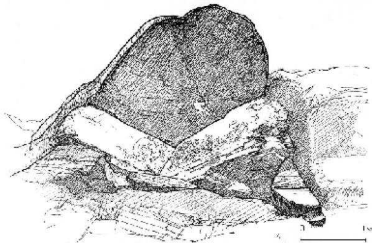
Рис. 1. Святилище Оргинек. Левый берег р. Кизилки. Междуречье Июсов

единую композицию. Сохранность памятника удовлетворительная, кроме нижней кромки плоскостей, слегка обрушенных, так как они находились в открытой зоне, незащищенной козырьком. Выбивка рисунков осуществлена острым ударным инструментом глубиной до 7 мм. Ширина деталей – линий до 3,5–4 см. Под плоскостями, у их нижнего основания, находится плита размером 1,5x0,7 м, размещенная с легким наклоном вправо и внутрь, как постамент. Вправо и ниже, в трех-четыре шагах – еще одна плита размером 0,5x0,9x0,3 м, лежащая строго горизонтально, очевидно, выломанная из скалы и уложенная здесь же. Полагаю, что данная плита есть жертвенник, который входит как составная часть в этот уникальный комплекс. От святилища до подножия горы – 20–25 м. Здесь других камней нет; сухой склон имеют только растительно-травяной покров.