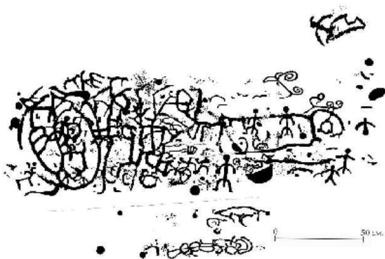
Рис. 3. Святилище Оргинек. Правая часть. Река Кизилка

гуры меньших размеров: две крайние зооморфные (телята или овны) и между ними знак «Овен», расположенный на боку. Далее изображения читаются уже с большим трудом. Это какие-то дуги, соединенные в секции (начало лабиринта), подобия знака «Овен», либо лапа птицы. Изображения отдельных деталей антропоморфных и зооморфных фигур. Внутри «лабиринта» – различного рода переплетения, пробитые вертикальными «отростками», сочлененными с боковыми линиями, заканчивающиеся вверху крупной точкой с изображением «затенения» или наоборот «света», выбитого мелкой дробью наподобие широких лучей. В этом «растительном» мире с трудом распознаются «бутоны-цветения», «птицы» и «животные» (олени).