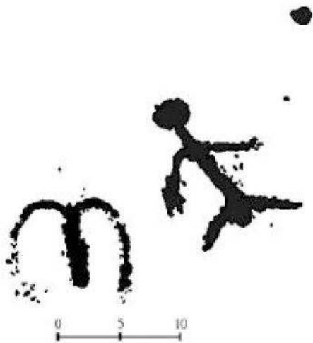
Рис. 3. Святилище Оргинек. Две фигуры. 10–12 м (восток)

Нижний ярус представляет узкую полосу, на которой находятся круги разных размеров, удлинённые завитки-переплетения, соединённые в гирлянду. В верхней части они образуют фигуру, внешне напоминающую стоящего с опущенной головой животного. Заканчивая описание, коснусь изображения третьего яруса, на котором расположена крупная антропоморфная фигура роженицы, лежащей на боку, нижняя часть туловища которой, окружена контуром «вод», с обозначенным плодом. Следует отметить, в 12–15 метрах вправо от описываемого святилища на одиночной плоскости (в верхней части) выбито изображение антропоморфной фигуры сидящей на корточках (той же роженицы?) и знака «Овен» под ней (рис. 4).