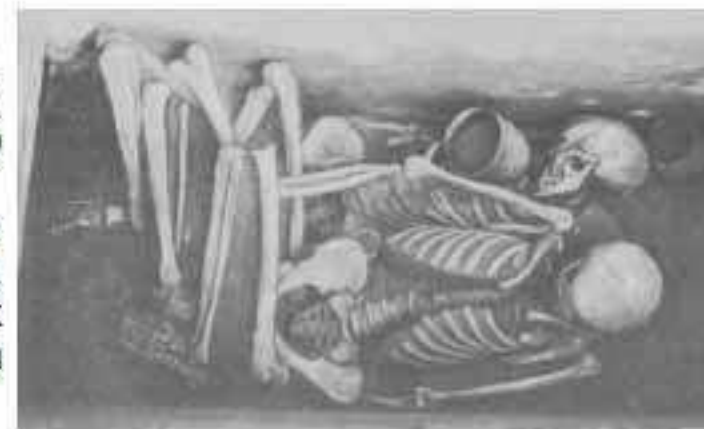
Рис. 3. Окуневский могильник Сыда V, к. 3, м. 12. Раскопки М.П. Грязнова (1965 г.). (Открыть Рис. 3 в новом окне)

но мелкими плитками. Ящики и ямы закрывали плитами и сооружали небольшой холмик из земли и камней. Реже встречаются ямы, покрытые брёвнами и поверх них — плитами. В нескольких случаях плиты над ямами уложены в виде купола, что делает их похожими на афанасьевские.