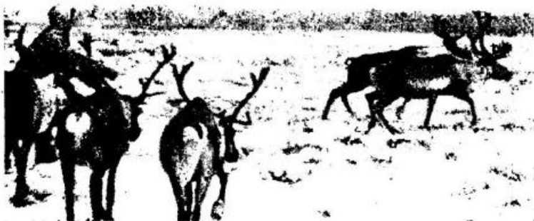
Рис. 2. Ловля оленей арканом. Пайтурма

Представление о том, какое место в хозяйстве колхоза занимает оленеводство, дают отчеты правления. Так, в 1956 г. колхоз только от продажи продукции оленеводства получил 480 тыс. рублей дохода. Кроме того, колхоз получил от извоза на оленях 72 тыс. рублей. Таким образом, его доходы от оленеводства в 1956 г. превысили 550 тыс. рублей при общем доходе колхоза в 643 тыс. рублей.