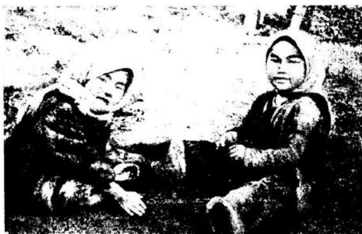
Рис. 8. Играющие дети. Усть-Боганида

Красный чум имеет библиотеку. В 1957 г. в ней насчитывалось более 400 книг, в том числе произведения дореволюционной русской, советской и зарубежной литературы. Красный чум систематически снабжается газетами и журналами.