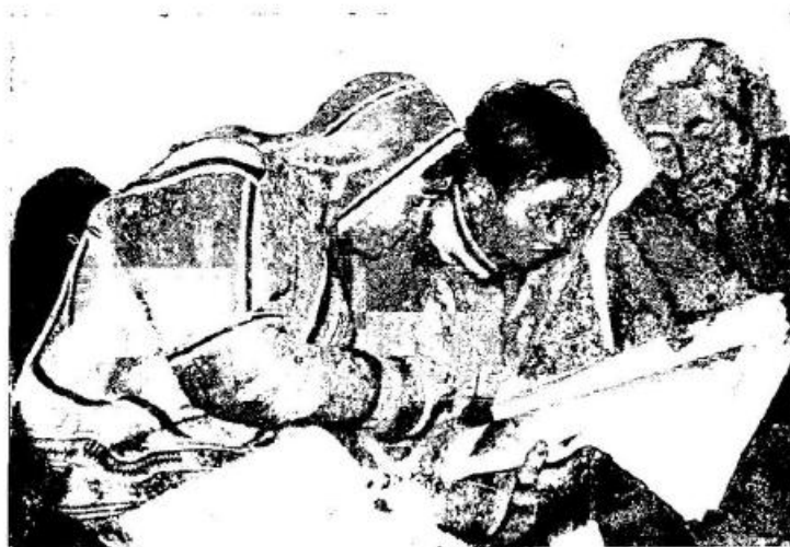
Рис. 7. Пастухи за чтением новых газет, привезенных в оленеводческую бригаду. Пайтурма

ны о внутренней жизни нашей страны. Во-вторых, киноустановка работает только на центральной базе колхоза, она слишком тяжела для перевозки на оленях из бригады в бригаду. Между тем, большинство колхозников почти круглый год находится в тундре со стадами или на охотничьих угодьях колхоза. Необходимо снабдить организации, ведающие культурным обслуживанием местного населения, легкими передвижными (на оленях) или смонтированными на вездеходах киноустановками.