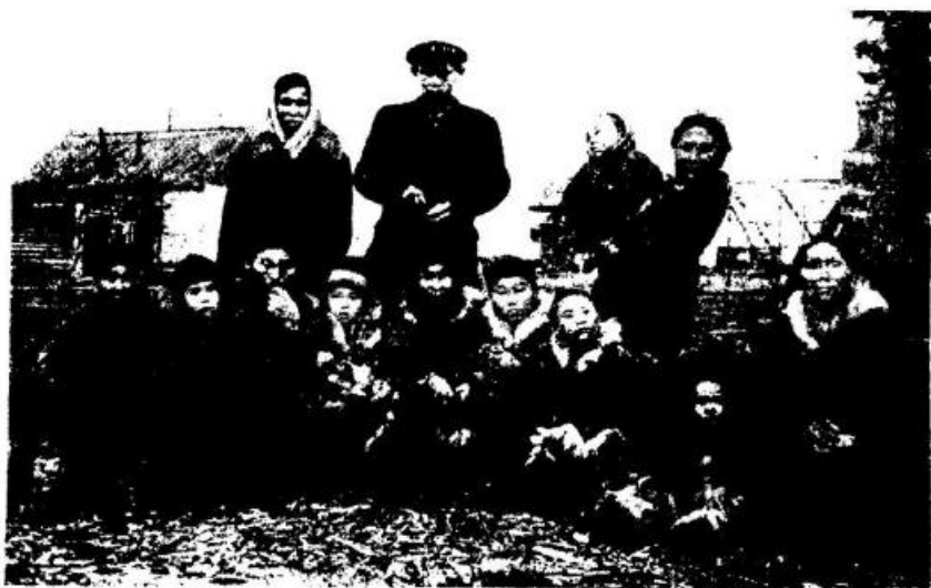
Рис. 6. Отправка детей в школу-интернат. Усть-Боганида

Культурно-просветительная работа в колхозе имени Шмидта ведется красным чумом. В его штате состоят четыре человека: заведующий, культмедик, учитель-библиотекарь и киномеханик. Работники красного