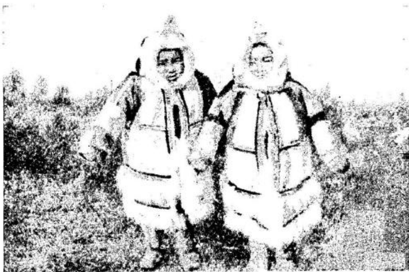
Рис. 5. Девочки в верхней зимней одежде — «сокуй». Усть-Боганида

В этой связи встал вопрос о том, как сделать более культурным быт оленеводов и охотников. Этот вопрос является особенно насущным сейчас, когда колхозы Таймыра вместе со всей страной вступили в эпоху перехода от социализма к коммунизму. Естественно, что в это время должен быть осуществлен резкий подъем культуры быта, одним из важных элементов которого является жилище. Создание новых типов передвижных летних и зимних жилищ не под силу одному колхозу или нескольким колхозам, пусть даже богатым. Но решению этого вопроса