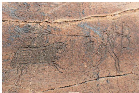
Рис. 6. Жалгыз-Тобе. Изображения воинов.

боты В. Д. Кубарева. Вклад этого исследователя в изучение петроглифических памятников региона трудно переоценить. Обобщение результатов многолетних изысканий в данной области представлено в его совместной монографии с Е. П. Маточкиным [1992]. Важной частью книги стал свод наскальных изображений Алтая, среди которых были кратко описаны и местонахождения с петроглифами раннего средневековья. Начиная с 1984 г. и на протяжении последующих лет В. Д. Кубаревым проводились планомерные исследования на известных комплексах Калбак-Таш-I и II. Среди композиций, скопированных на этих памятниках, часть рисунков, главным образом, демонстрирующих сцены охоты и выполненных в технике гравировки, относятся ко второй половине I тыс. н.э. [Kubarev, Jacobson, 1996, fig. 2–6; Кубарев, 2007, рис. 1, 5; 2011, с. 63, прил. II, 2–5 и др.]. На святилище Калбак-Таш-I открыта также значительная серия тюркских рунических надписей [Кубарев, 2011, с. 392–402]. Отдельным направлением исследований В. Д. Кубарева стал