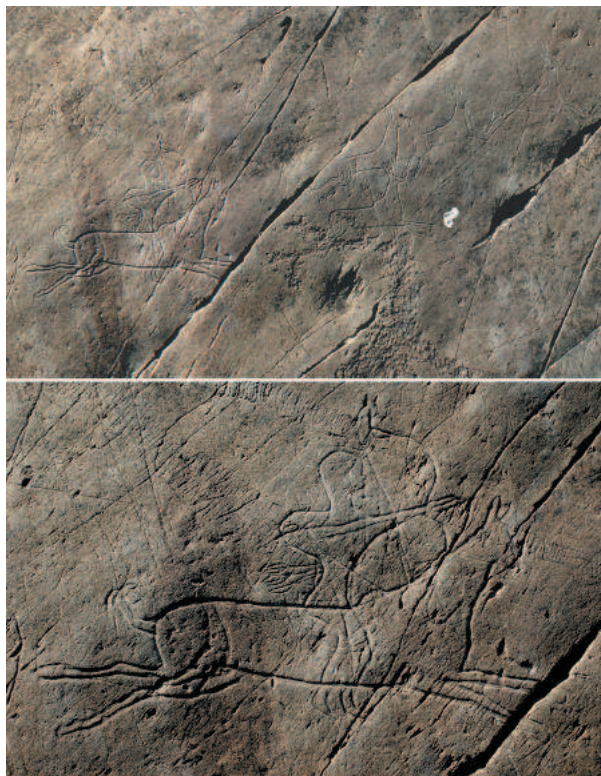
Рис. 1. Калбак-Таш III. Сцена охоты лучника на оленей и её фрагмент.

Миклашевич, 2000]. В качестве самостоятельного аспекта разрабатывается проблема документирования раннесредневековых изображений Алтая [Черемисин, 2004; 2011; Черемисин, Миклашевич, Бове, 2013; и др.]. С исследованием наскальных рисунков связано изучение раннесредневековых личных тамг и надписей на скалах. Большая их часть находится на одних плоскостях с петроглифами и должна рассматриваться в контексте (см. обзоры: [Кубарев, 1992; Кубарев, Маточкин, 1992, с. 14–16; Кызласов, 1992; 2003; и др.]). Очевидно, что на сегодняшний день необходимо разноплановое обобщение имеющихся материалов. Одним из аспектов такого исследования является анализ истории изучения петроглифов второй половины I тыс. н.э. на территории Алтая.