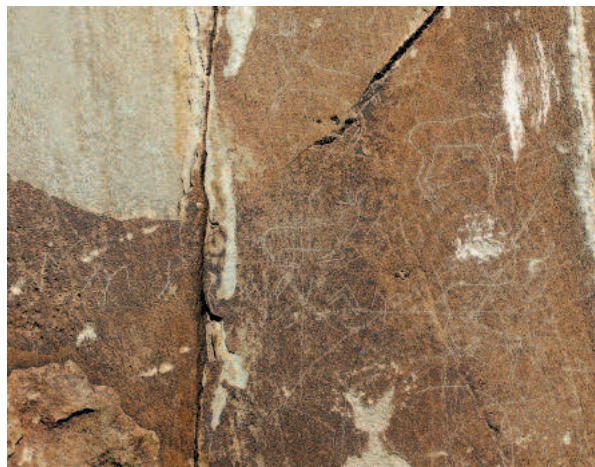
Рис. 5. Адыр-Кан. Фрагмент многофигурной композиции с изображениями животных и рунической надписью.

Изучение наскальных изображений Алтая различных хронологических периодов являлось одним из приоритетных направлений ра-