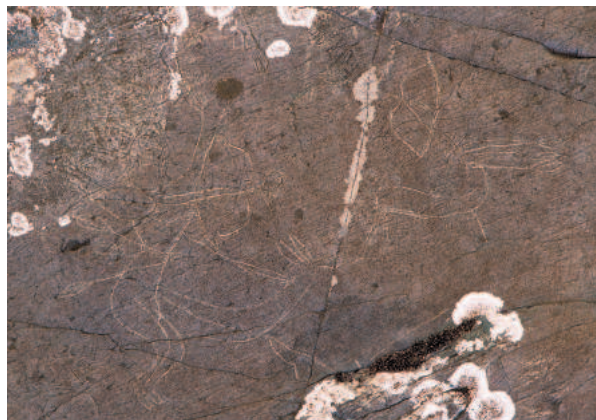
Рис. 3. Калбак-Таш II. Сцена охоты.

ду с петроглифами различных периодов фиксируя изображения эпохи раннего средневековья. Обобщение известных ему материалов с использованием сведений учёных и путешественников XIX – начала XX вв. он привёл в статье 1947 г., представив краткую характеристику основных местонахождений. Помимо наскальных рисунков П. П. Хороших [1947, с. 31, 32] остановился на описании упомянутой выше сцены на валуне из комплекса Кудыргэ, подчеркнув исключительное значение данного объекта. Отдельно в статье был приведён список литературы «об алтайских писаницах» [Хороших, 1947, с. 33, 34]. В специальной публикации П. П. Хороших [1949, с. 132, 133] представил результаты изучения наскальных рисунков на комплексе Ялбак-Таш (Калбак-Таш). Известные ему изображения данного памятника археолог отнёс к скифской эпохе. Несмотря на неточности, допущенные при описании многих местонахождений наскальных рисунков, на которые впервые обратили внимание В. Д. Кубарев и Е. П. Маточкин [1992, с. 6, 7], с работами П. П. Хороших, несомненно, связано постепенное повышение интереса к петроглифам Алтая, в том числе к рисункам раннего средневековья.