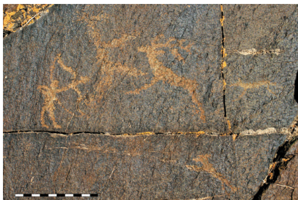
Рис. 9. Хар-Хад. Сцена охоты лучника с собаками на оленя; фигура между лучником и оленем нанесена позднее.