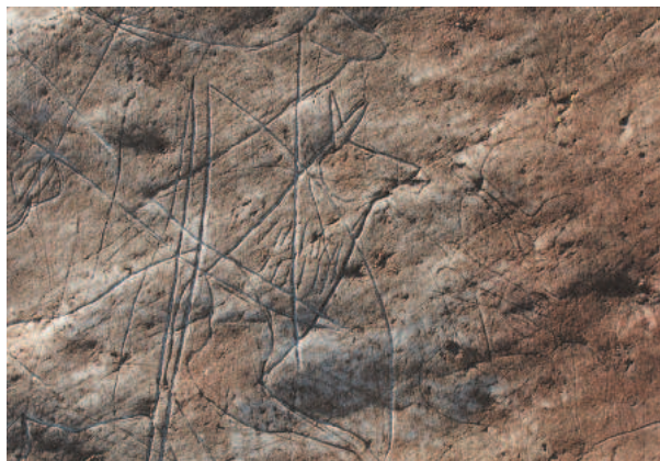
Рис. 2. Калбак-Таш II. Фрагмент сцены охоты.