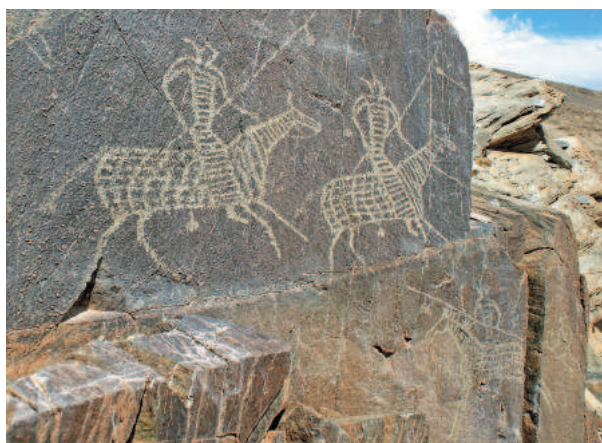
Рис. 8. Хар-Хад. Фрагмент композиции с катафрактариями.