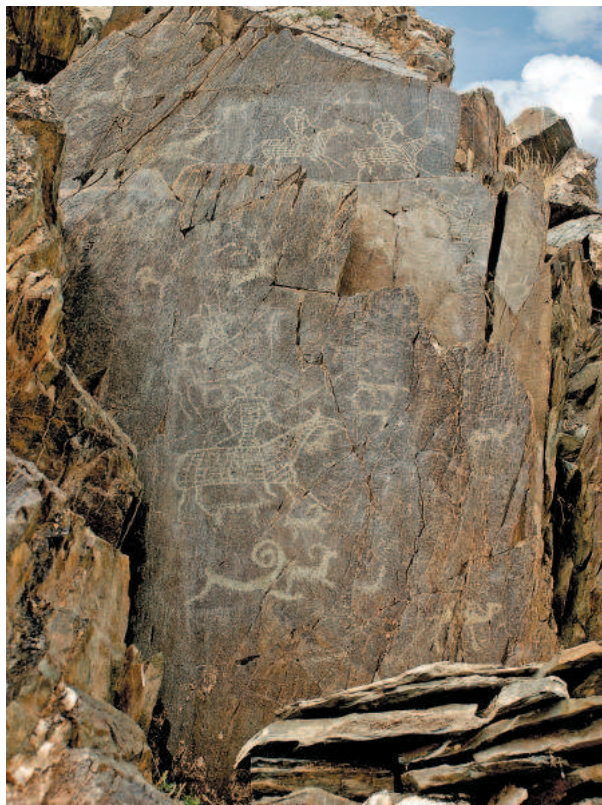
Рис. 7. Хар-Хад. Композиция с катафрактариями.