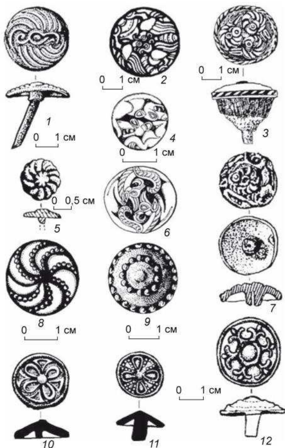
Рис. 2. Триквестры Северного Алтая. 1 – Барангол-2; 2, 8, 9 – Чултуков Лог-1; 3 – Майма IV; 4, 6 – Барангол-1; 5 – Сургайка-1; 7 – Покровский Лог-5; 10 – Черный Ануй-3; 11 – Майма XIX; 12 – Верх-Еланда-2.

В захоронении кург. 1 могильника Барангол-1 четверо погребенных были уложены головой на юго-запад, на правом боку с согнутыми в коленях ногами. Скелет 1 принадлежал мужчине в возрасте 60–65 лет. Сопроводительный инвентарь – плохо сохранившийся железный кинжал длиной ок. 20 см. Скелет 2 (женщины 45–50 лет) располагался справа от первого. В изголовье лежал на боку кувшинообразный керамический сосуд, орнаментированный резной штрихованной сеткой по горловине. Здесь же обнаружены потревоженные бараньи позвонки и железный нож. В изголовье находились расположенные веером три железные стержневые булавки, служившие для закрепления прически. Две из них звездчатые, со шляпками, покрытыми золотой фольгой, третья – с фигурным окончанием в виде птицы. На черепе обнаружены две бронзовые проволочные S-образные серьги. Скелет 3, очень плохо сохранившийся во влажном грун-