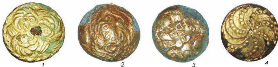
Рис. 3. Триквестры Северного Алтая с изображениями баранов (1), грифонов (2), волков (3) и с солярным орнаментом (4).

1 – Майма IV; 2, 3 – Барангол-1; 4 – Чултуков Лог-1.