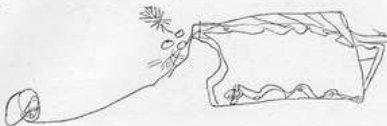
Рис. 1. Дорога к божествам огня.

к «оімок-арӯ», они соединяют с представлением о печи, в которой находится огонь и, следовательно, все те духи, которые с ним связываются. По рисунку видно, что кам начинает свой путь от трех очагов (о них ниже), которые